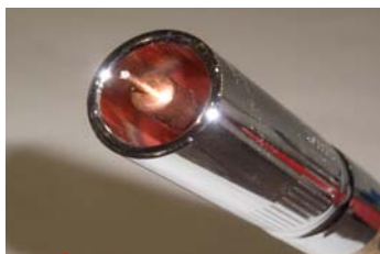
そのまま溶接した場合

「朝1回スプレーすると一日中効果が実感できるから、ランニングコストも全然気にならないね」