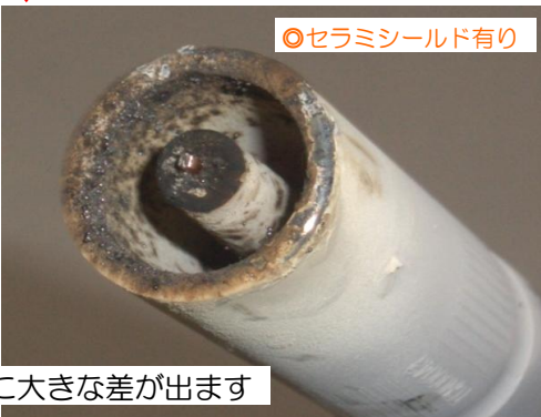
スパッタの付着に大きな差が出ます