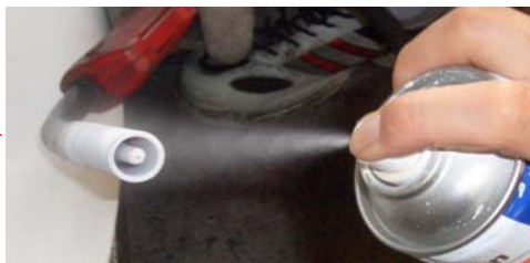
セラミシールドをスプレーしてから溶接した場合