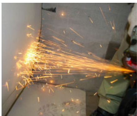
サンダーの火花の保護に