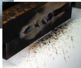
工場内の 5S 活動にも役立ちます