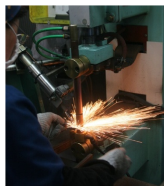
スパッタ付着防止に