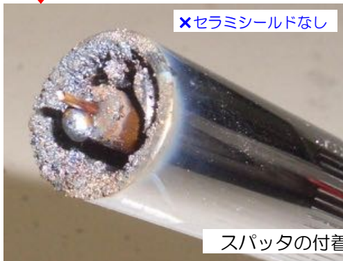
×セラミシールドなし