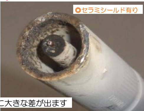
○セラミシールド有り